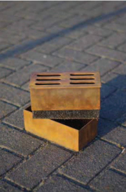
Steen eruit, drainbrick erin en de plas is weg.

meter extra infiltreert in de bodem ter plaatse van de boomspiegel. Een hoeveelheid waarmee de gemiddelde boom zijn niet aflatende dorst voor een groot deel kan lessen.