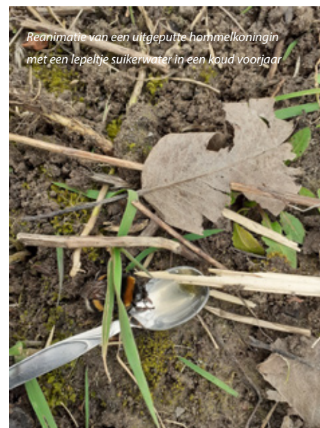
Reanimatie van een uitgeputte hommeling met een lepeltje suikerwater in een koud voorjaar

en landbouwers. Daarnaast legt de stichting bijenoases aan. 'Dat zijn bloemrijke en gelaagde plekken waar bijen kunnen nestelen en eten', legt Vismans uit. En als derde geeft Bee Foundation 'Bijensteken'. Vismans lacht: 'Dat is een aardig woord voor dat we af en toe iets corrigeren. Onlangs is er bijvoorbeeld nog een motie uitgebracht bij de provincie Utrecht en nu wil men verder onderzoek rond de recente bijensterfte. Dan helpen we dat onderzoek vervolgens ook uitvoeren.' Vismans vertelt verder dat Bee Foundation momenteel onderzoekt hoe het mogelijk is om de bij een stem te geven, om van de bij gezegd een rechtspersoon te maken, net zoals de natuur steeds vaker een stem krijgt. 'Dat is een langduriger project, maar valt ook onder de Bijensteken.'