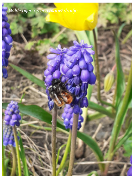
Wildevij op een blauw druifje