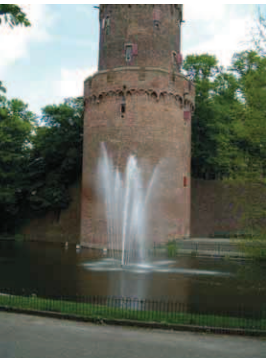
De verschillende waterpompen in de Nijmeegse stadsvijver houden het water in beweging. Dat is van belang: zo komen er constant algen voorbij die de mosselen kunnen eten.

24 graden Celsius. 'Algen zijn dol op warm water. De temperatuur van het vijverwater wordt gemeent met meetsensoren. Als het water te warm wordt, pompen we grondwater bij het vijverwater om het te koelen en te zuiveren om de visstand te behouden. Het probleem is echter dat het biologisch evenwicht in de vijver verloren gaat door vervanging van het vijverwater; de vijver is een gesloten systeem. Dus we wilden vooral proberen om de algen weg te krijgen. Dit doen we nu met de inzet van mosselen, die de algen opeten en zich daardoor razendsnel vermeerderen.'