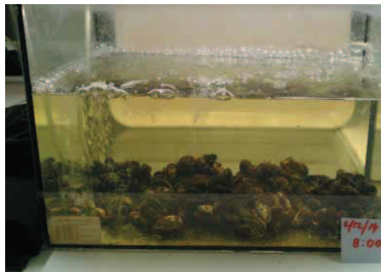
Aan het einde van de proef hebben Quagga-mosselen het water van alle algen gezuiverd.