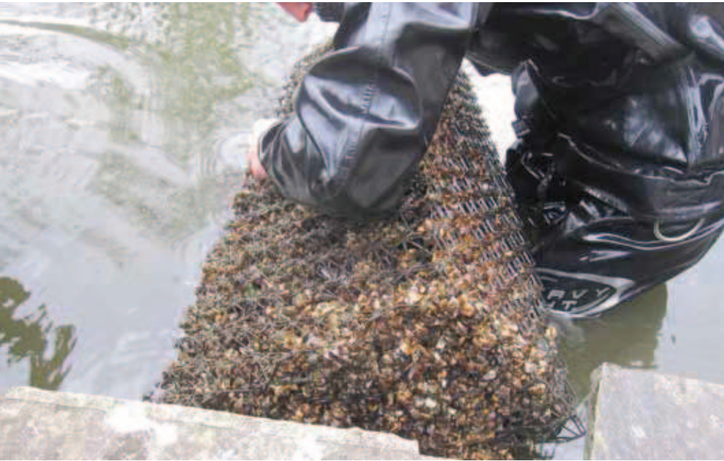
Het plaatsen van de mosselkragen.