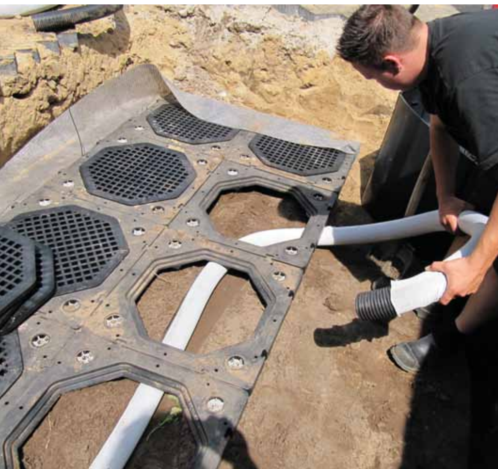
Het Treeparker-systeem is op verschillende manieren toe te passen.

Hendriks: 'De staanders in ons systeem voeren overtollig water af naar de ondergrond. Het hele systeem is nu een boombunker inclusief waterafvoer. Het werkt zo: regenwater wordt afgevoerd via de straatkolk. Momenteel gebruiken we nog een gewone deksel op de staanders, die het geheel afsluit. We zijn bezig een nieuwe deksel te ontwikkelen, die ervoor zorgt dat het overstrommechanisme ook in het systeem zit. Water kan dan via de deksel overstromen in de staanders. De staanders zijn dan waterreservoirs die 6 tot 8 procent meer water bergen bovenop de 20 tot 25 procent waterberging in de aanwezige grond. Zo wordt ruim 30 procent waterbergend vermogen gecreëerd, waarbij het vuile water wordt gezuiverd door het bodemleven. Het schone water infiltreert in de grond of stroomt over in de waterbergende staanders.' Dit systeem wordt inmiddels over de hele wereld toegepast. De installaties van Greenmax zijn voornamelijk te vinden in Europa, Israël en het Midden-Oosten (Bahrein en Dubai).