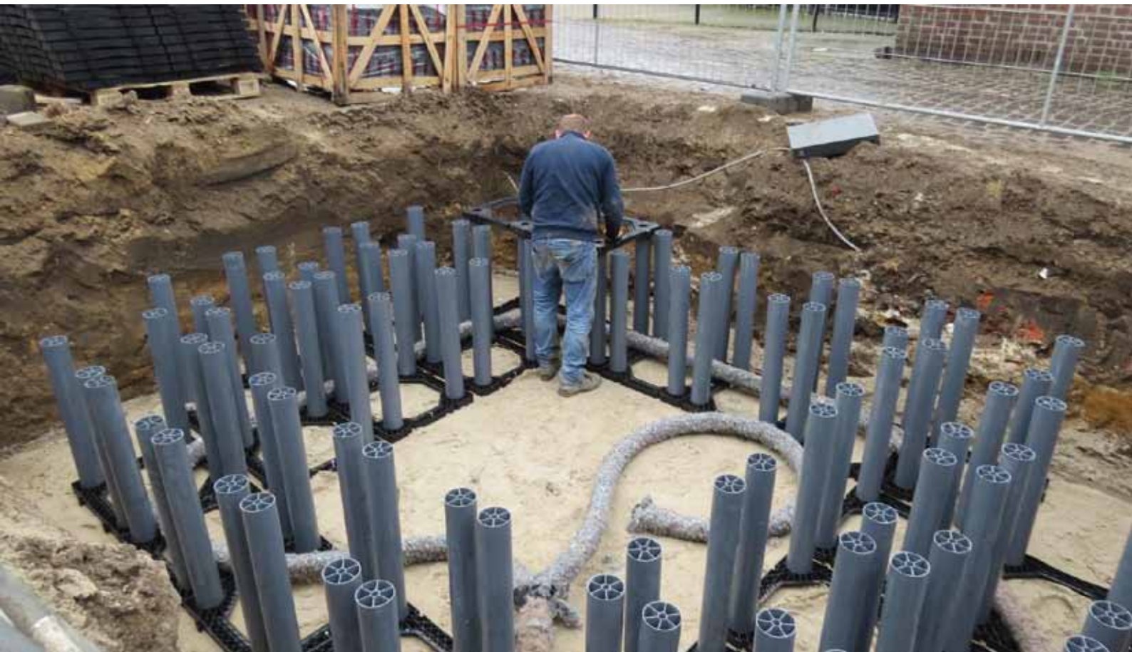
Boombunker in aanbouw in Venray.

Het Treeparker-systeem is op verschillende manieren toe te passen. Veelvoorkomend is de combinatie van wateropvang in de straatkolk (put), die overstroomt in de boombunker. Het water verspreidt zich dan in het tweede maaiveld over het totale worteloppervlak van de boom. Het water infiltreert in de grond, waar het door het bodemleven gezuiverd wordt. Zelfs brandstof en olie worden hierin afgebroken.