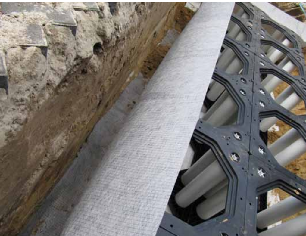
Het hele systeem is een boombunker inclusief waterafvoer.

Hendriks: 'De staanders in ons systeem voeren overtollig water af naar de ondergrond. Het hele systeem is nu een boombunker inclusief waterafvoer. Het werkt zo: regenwater wordt afgevoerd via de straatkolk. Momenteel gebruiken we nog een gewone deksel op de staanders, die het geheel afsluit. We zijn bezig een nieuwe deksel te ontwikkelen, die ervoor zorgt dat het overstrommechanisme ook in het systeem zit. Water kan dan via de deksel overstromen in de staanders. De staanders zijn dan waterreservoirs die 6 tot 8 procent meer water bergen bovenop de 20 tot 25 procent waterberging in de aanwezige grond. Zo wordt ruim 30 procent waterbergend vermogen gecreëerd, waarbij het vuile water wordt gezuiverd door het bodemleven. Het schone water infiltreert in de grond of stroomt over in de waterbergende staanders.' Dit systeem wordt inmiddels over de hele wereld toegepast. De installaties van Greenmax zijn voornamelijk te vinden in Europa, Israël en het Midden-Oosten (Bahrein en Dubai).