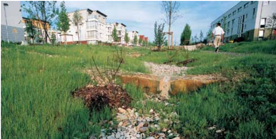
Een regentuin is een wadi, maar dan met houtachtige beplanting.