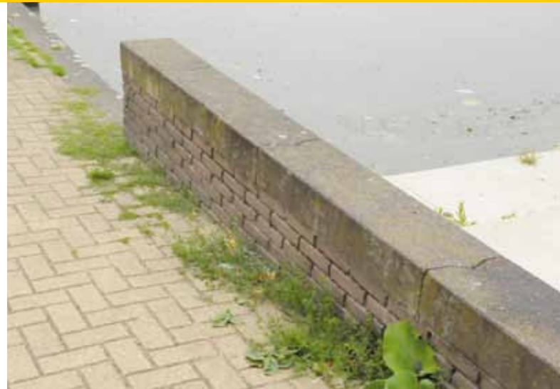
Vorig jaar is het kwaliteitsniveau verlaagd van B naar C. Dat leverde opvallend weinig klachten op.

met windoverlast. We zitten relatief dicht bij zee en rondom die nieuwe, kale flats kon het enorm waaien. Daarom hebben we daar snelgroeiende bomen geplant, zoals bijvoorbeeld wilg en populier en verder bosplantsoen. Heel veel van die populieren en wilgen zijn overigens al weer gekapt.'