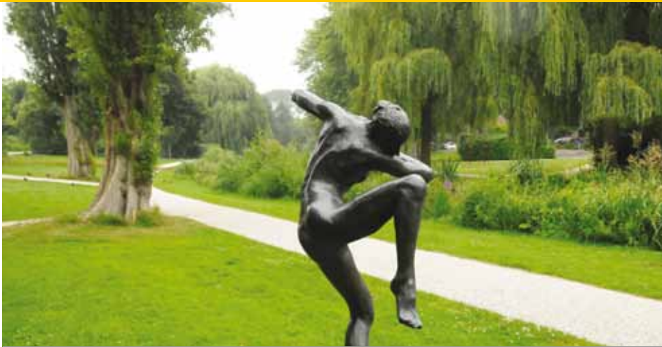
Ook opvallend groene plekken in Zoetermeer.

kregen voor een periode van tien jaar. Dat geldt overigens ook voor de aannemer. Normaal werkt Zoetermeer met contractperiodes van drie jaar. Bunnik heeft een contract van tien jaar. De overige vier wijken werden al langer onderhouden door de aannemer. Dit zijn achtereenvolgens Meerzicht die door Ballast Nedam wordt onderhouden, de wijk Seghwaert/Noordhove die Hoek Hoveniers in contract heeft, Rokkeveen door Van der Spek, Buytenwegh/De Leyens door Gebr. Van Doorn en ten slotte de wijk Oosterheem door Vermeulen Benthuisen. Voor de recreatiegebieden is een aparte bestek op de markt gebracht. Met het vertrek van de laatste 35 eigen mensen in de uitvoering zijn in Zoetermeer nog twee bureaus over die zich bezighouden met het openbaar gebied. Dat zijn het bureau Beleid en Programmering en een tweede bureau: Regie. Omdat het laatste jaar is gebleken dat de communicatie tussen deze twee diensten nog niet helemaal optimaal is, wordt nu een aantal verbindingsmensen aangesteld, zodat beleid en regie beter op elkaar afgestemd worden.