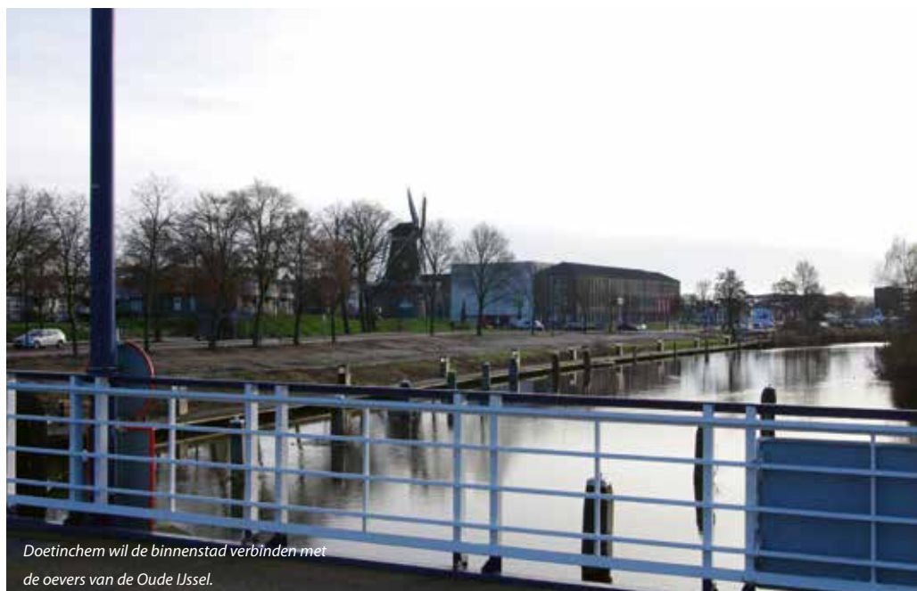
Doetinchem wil de binnenstad verbinden met de oevers van de Oude IJssel.

Inwoners spelen een belangrijke rol bij de transitie van De Veentjes naar groen woongebied. 'Veel nieuwe wijkbewoners zijn ouderen die kleiner zijn gaan wonen. Die hebben nog wel groene vingers, maar niet meer een eigen