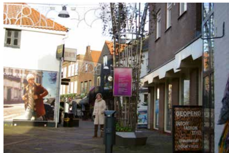
Soms zijn er creatieve oplossingen nodig om het stadshart te vergroenen.