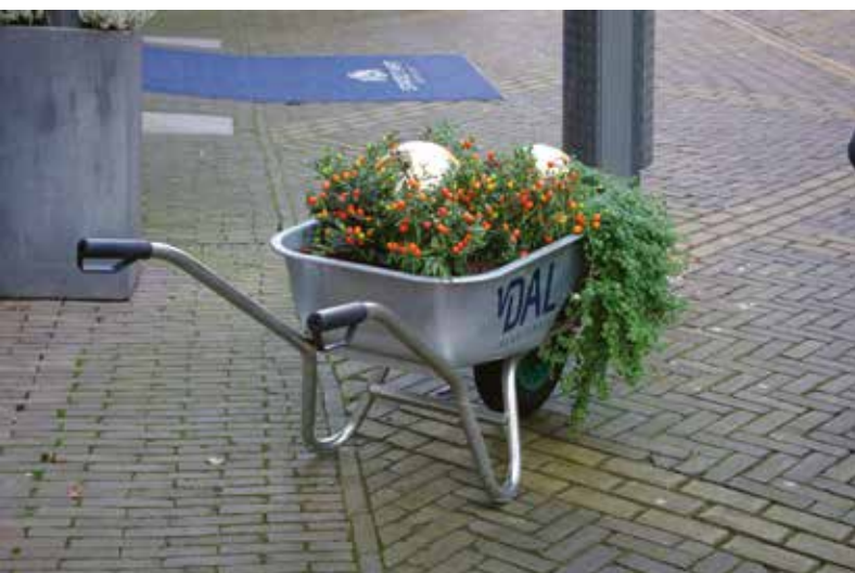
Winkeliers voegen nu zelf groen toe aan de binnenstad.

Het is goed te zien dat het bepaald geen sinecure is om in een compacte binnenstad zoals Doetinchem heeft op passende wijze groen toe te voegen. Daar is duidelijk creativiteit voor nodig geweest. Zo zijn er op verschillende plekken in de binnenstad kunstzinnige boomachtige constructies te zien waarin groen naar boven kan klimmen. 'We kunnen hier niet