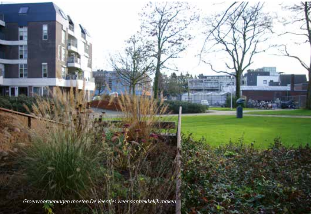
Groenvoorzieningen moeten De Veentjes weer aantrekkelijk maken.

overal de grond in. We hebben met veel ondergrondse infrastructuur te maken. We hebben daarom samen met winkeliers dit bedacht: constructies met bankjes eromheen om op te zitten en zelfs met verlichting ingebouwd. Welke planten het hier het beste doen, moeten we nog een beetje proefondervindelijk leren.' Verderop hebben winkeliers kruiwagens buiten staan met planten erin. Dat is het resultaat van een actie van de gemeente om de stenige binnenstad een groener aanzien te geven. 'We proberen in de binnenstad zoveel mogelijk kleine stukjes groen toe te voegen. Dit is daar een voorbeeld van.' De kruiwagens zijn later verkocht aan de winkeliers om zelf een vervolg te geven aan het initiatief. Dat is kennelijk aardig gelukt, want een aantal van de kruiwagens bevat nog steeds planten. Anderen tonen koopwaar en, in de decembermaand, kerstversiering aan het winkelend publiek.