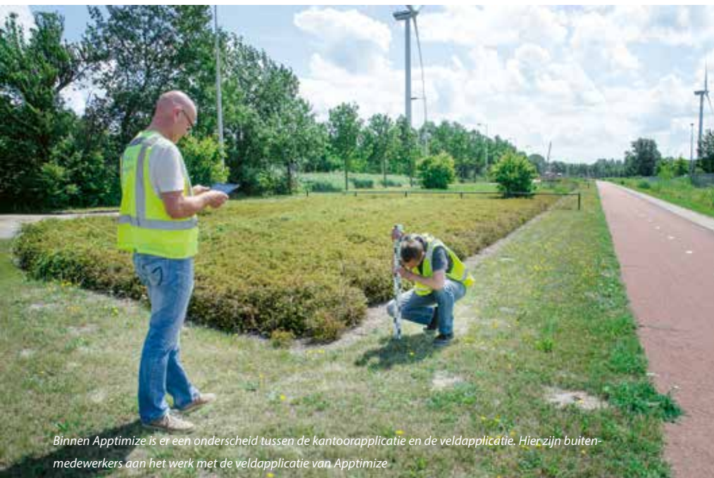
Binnen Apptimize is er een onderscheid tussen de kantoorapplicatie en de veldapplicatie. Hier zijn buitenmedewerkers aan het werk met de veldapplicatie van Apptimize