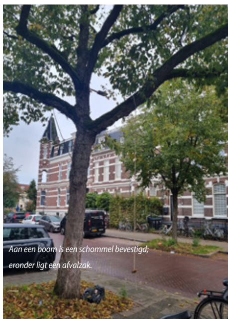
Aan een boom is een schommel bevestigd; eronder ligt een afvalzak.