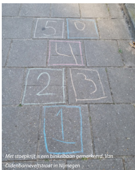
Met stoepkrijt is een hinkelbaan gemarkeerd. Van Oldenbarneveltstraat in Nijmegen

met alleen maar toestellen. Op georganiseerde speelplekken met alleen toestellen wordt spel gestructureerd. Op informele speelplekken, met name in het groen, zijn de speelmogelijkheden veel breder. Dit klinkt tegenstrijdig, maar wanneer er geen toestellen zijn die het spel structureren, bedenken kinderen hun eigen spel. Daarnaast doen kinderen meer directe natuurervaringen op. Bij de gemeente hebben we de subsidie groene schoolpleinen en willen we meer inzetten op groene (ontmoetings) plekken waar ruimte is voor vrije spelvormen in het groen. In combinatie met plekken waar wel toestellen staan, zorgen we voor een breed aanbod aan speelgelegenheden. Het groen kan daarnaast bijdragen aan meerdere doelstellingen, zoals biodiversiteit en klimaatadaptatie.