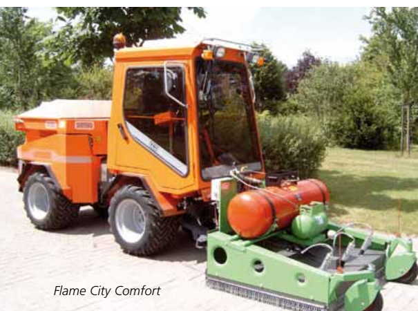
Flame City Comfort