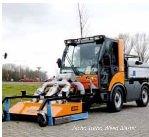
Zacho Turbo Weed Blaster