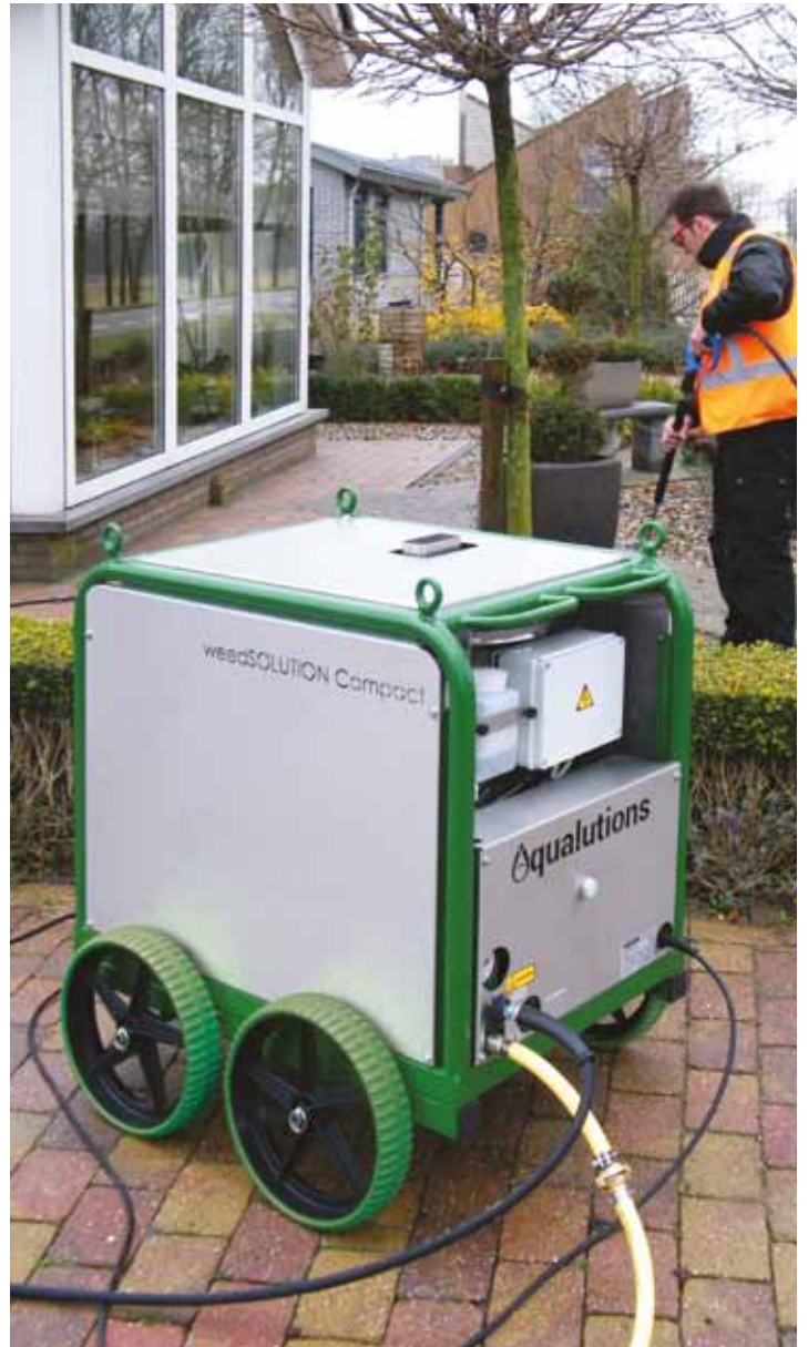
De WS Compact voor de hovenier heeft een buitenkraan en een stopcontact nodig om effectief onkruid te bestrijden.