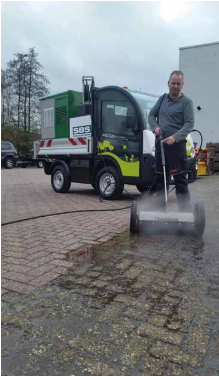
De WS I kan net als de WS II op verschillende voertuigen worden gemonteerd, in dit geval op een elektrisch voertuig.

Waardoor is die effectiviteit zo hoog, en waarom is bij een dergelijk groot voordeel nog niet iedereen overgestapt op bestrijding met heet water? 'De effectiviteit heeft te maken met de warmtegeleiding van water', aldus Verhelst. 'Hoe hoger de watertemperatuur, hoe hoger de effectiviteit. Het doel is het bestrijden van kiemen en die zitten vaak dieper onder de grond. Hete lucht heeft een zogenaamde warmtecoëfficiënt van 0,023, die van