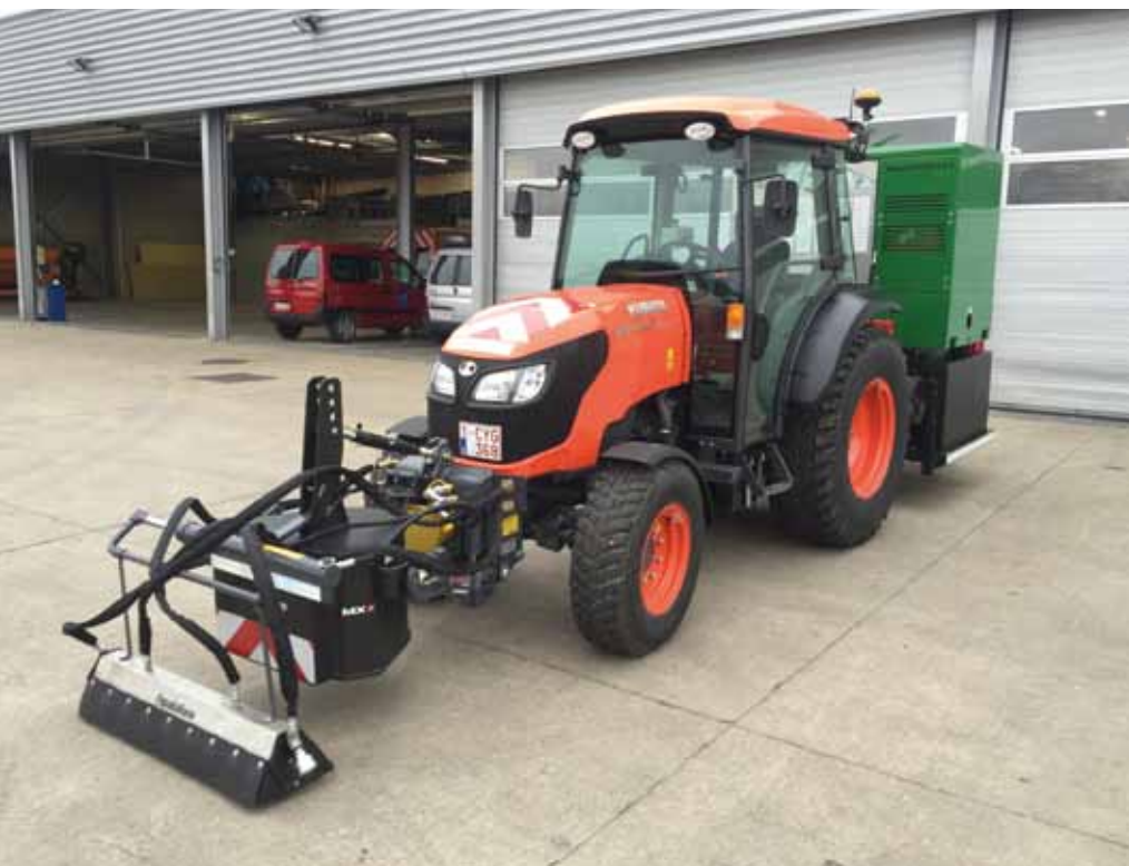
Met een spuitbalk wordt onkruidverwijdering gemakkelijker, in dit geval met een brede balk (100-230 cm) en de WS II.

zes euro kwijt. Bovendien gebeurt de aandrijving van de pomp bij ons met een accu van 72 V en is er geen brandstofmotor nodig. Daarmee bespaar je niet alleen op benzinekosten, maar produceer je ook veel minder lawaai. Dieselbranders hebben nog een groot nadeel: ze produceren ongeveer zes maal zo veel roet als een dieselmotor van een auto. Vreemd dat je aan de ene kant het milieu spaart en het aan de andere kant gelijktijdig onnodig belast. Bovendien: als je nu al ziet dat oudere dieselauto's geweerd worden uit stadscentra, hoe lang duurt het dan voordat meer vervuilende apparaten de toegang ontzegd wordt?