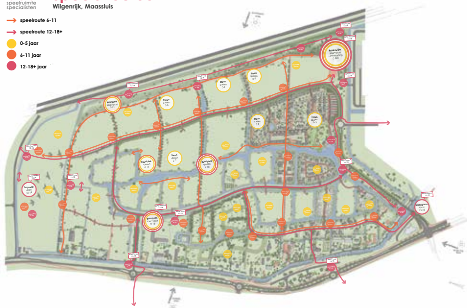
Masterplan spelen Wilgenrijk