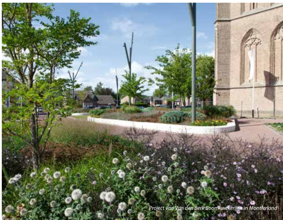
Project van Van den Berk Boomkwekerijen in Montferland