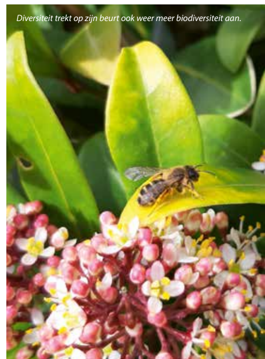
Diversiteit trekt op zijn beurt ook weer meer biodiversiteit aan.