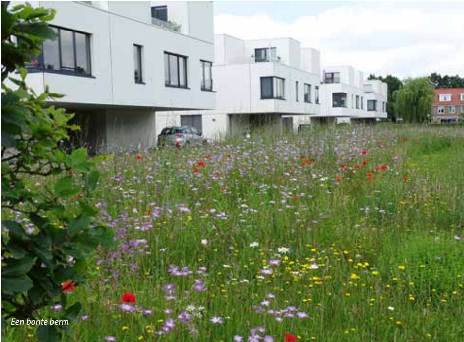
Een bonte berm