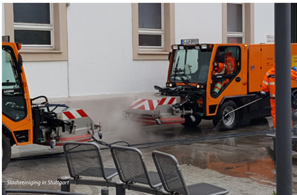
Stadsreininging in Stuttgart