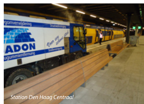
Station Den Haag Centraal

Gemeente Katwijk heeft opdracht verstrekt voor de reiniging en kauwgomverwijdering van diverse winkelcentra binnen haar gemeente. Hier wordt gebruikgemaakt van oppervlaktewater voor de reiniging. Jadon reinigt frequent diverse winkelcentra, zodat het straatbeeld op een goed niveau blijft. De winkelcentra variëren in grootte van 450 tot 2600 vierkante meter. Gemeente Bielefeld heeft een meerjarige opdracht verstrekt voor het reinigen van Jahnplatz. Dit is een nieuw ingericht plein, centraal in het centrum van Bielefeld, met twee grote bushaltes en een evenementenplein dat aansluit op het kernwinkelgebied. Het project omvat frequente reiniging van Chinees graniet, inclusief reiniging van de inrichting. De bushaltes worden viermaal per jaar intensief gereinigd; het plein krijgt een jaarlijkse onderhoudsbeurt. Projectgrootte: 15.000 vierkante meter. Na een eerste grootschalige reiniging die Jadon vorig jaar heeft uitgevoerd, heeft Stadt Mannheim opdracht verstrekt om 30.000 vierkante meter bestrating te reinigen en te ontdoen van kauwgom. De centrale winkelstraat, inclusief trambaan en zijstraten, zijn voorzien