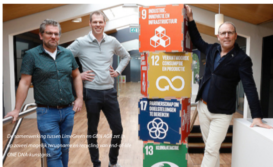
De samenwerking tussen LimeGreen en GBN AGR zet in op zoveel mogelijk terugname en recycling van end-of-life ONE DNA-kunstgras.

Het take-back-programma bestaat uit twee innamestromen: een voor schoon snijafval en een voor vervuild end-of-life kunstgras. Samen