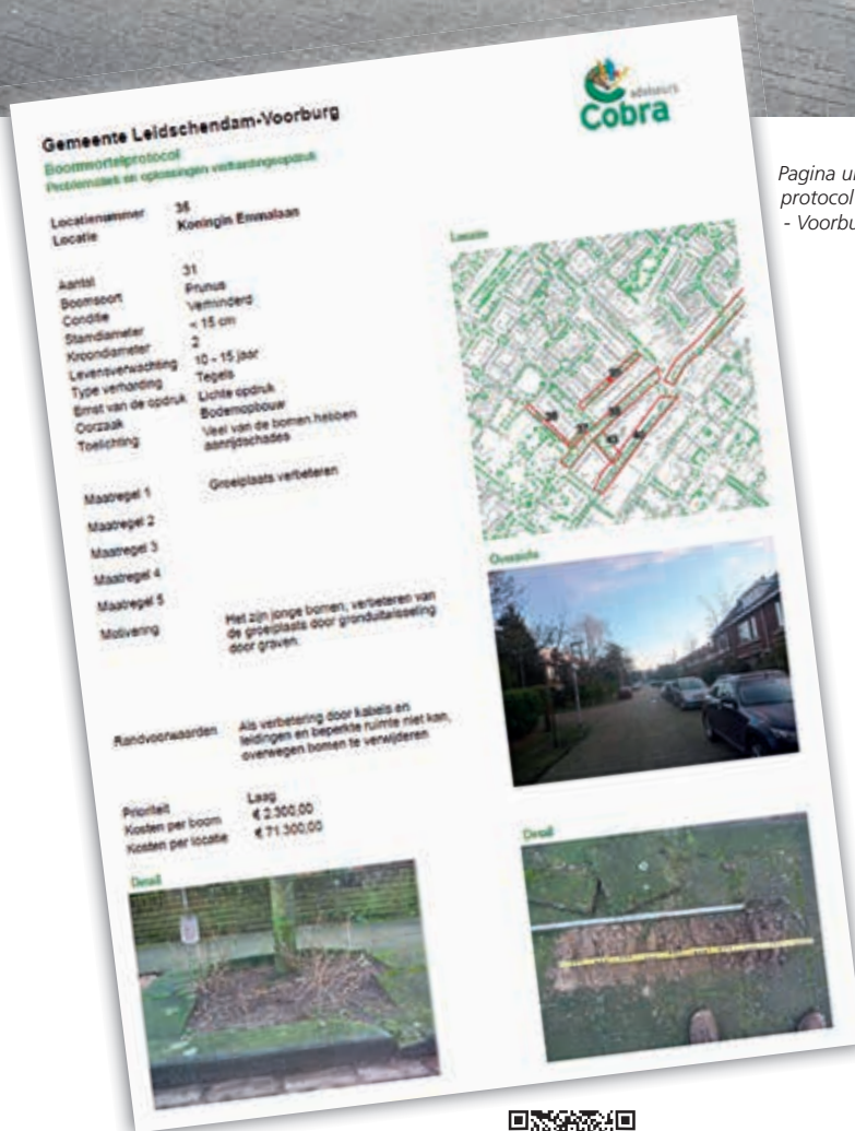
Pagina uit boomwortelprotocol Leidschendam - Voorburg