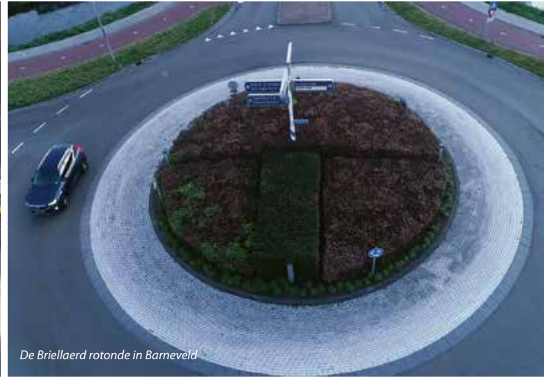
De Briellaerd rotonde in Barneveld

Angela's Tuinen heeft 'Het wonder van Woerden' ontworpen en na goedkeuring van de gemeente is De Aar Hoveniers aan de slag gegaan met de aanleg. In het concept is uitgegaan van een rotonde waar de identiteit en historie van de stad Woerden tot uitdrukking komen. Dwars over de rotonde is met blauw-grijze Rijntjes iets verdiept ten opzichte van de rest van de rotonde de rivier weergegeven, waarboven een aantal vissen zwemmen in de richting van de stad. De Rijntjes zijn zowel een verwijzing naar de rivier de Oude Rijn als naar de baksteen- en dakpanindustrie van Woerden. De cortenstalen vissen op standaard verwijzen natuurlijk naar het Wonder van Woerden, waarbij tijdens de belegering door de Spanjaarden een hongersnood werd afgewend door de komst van een grote hoeveelheid vissen die via de Oude Rijn de stad binnenzwommen, zodat de inwoners weer te eten hadden. Op de rotonde is een levendige beplanting aanwezig die het grootste deel van het jaar kleur, structuur en beleving