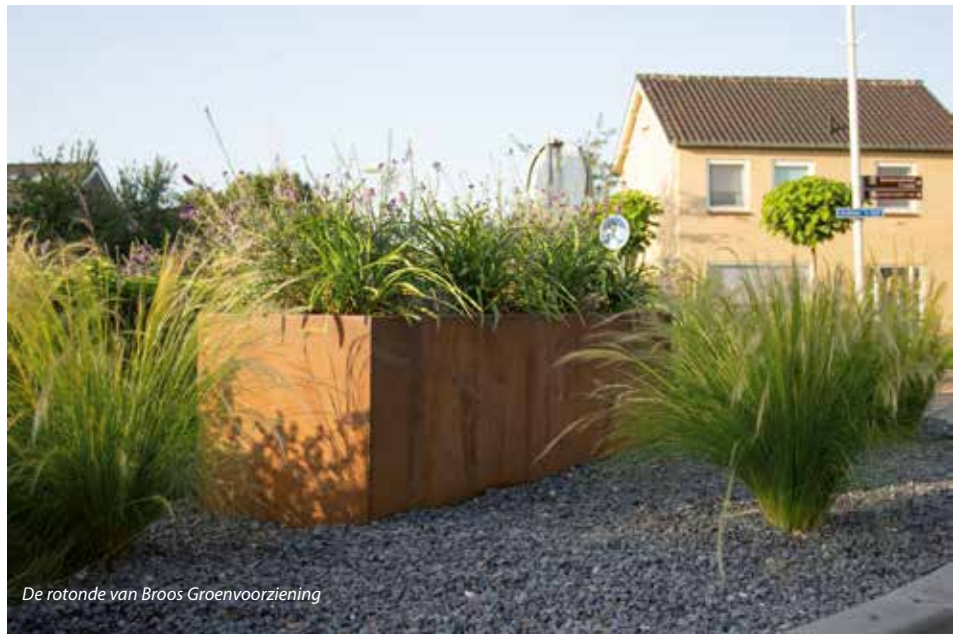
De rotonde van Broos Groenvoorziening

Angela's Tuinen heeft 'Het wonder van Woerden' ontworpen en na goedkeuring van de gemeente is De Aar Hoveniers aan de slag gegaan met de aanleg. In het concept is uitgegaan van een rotonde waar de identiteit en historie van de stad Woerden tot uitdrukking komen. Dwars over de rotonde is met blauw-grijze Rijntjes iets verdiept ten opzichte van de rest van de rotonde de rivier weergegeven, waarboven een aantal vissen zwemmen in de richting van de stad. De Rijntjes zijn zowel een verwijzing naar de rivier de Oude Rijn als naar de baksteen- en dakpanindustrie van Woerden. De cortenstalen vissen op standaard verwijzen natuurlijk naar het Wonder van Woerden, waarbij tijdens de belegering door de Spanjaarden een hongersnood werd afgewend door de komst van een grote hoeveelheid vissen die via de Oude Rijn de stad binnenzwommen, zodat de inwoners weer te eten hadden. Op de rotonde is een levendige beplanting aanwezig die het grootste deel van het jaar kleur, structuur en beleving