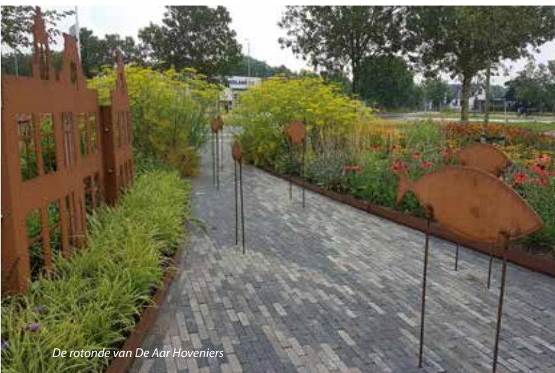
De rotonde van De Aar Hoveniers