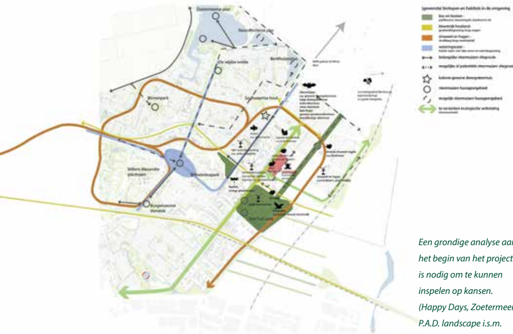
Een grondige analyse aan het begin van het project is nodig om te kunnen inspelen op kansen. (Happy Days, Zoetermeer. P.A.D. landscape i.s.m. plein06)