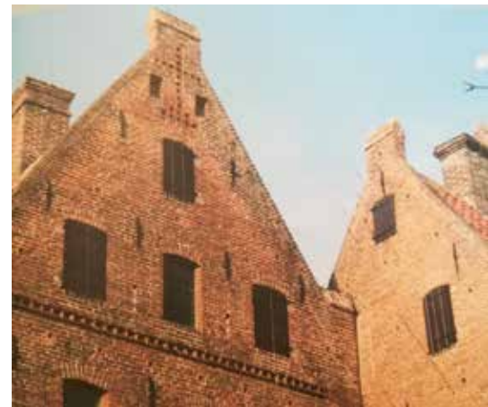
In 1418 werd al gebruikgemaakt van ecosysteemdiensten door in de gevel van het Agnietenklooster nestkasten te integreren voor de gierwaluw. (Foto uit boek Stadsnatuur maken , Vink, Volvaard, De Zwarte)