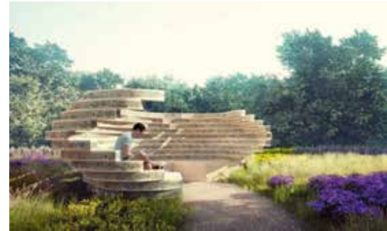
Wanneer we natuurinclusief ontwerpen vanaf het begin meenemen in het proces, vergroten we de esthetische waarde. Deze bank is behalve ontmoetingsplek en kunstwerk ook een nestplaats voor solitaire bijen. (BuzzBench Anne Marie van Splunter)