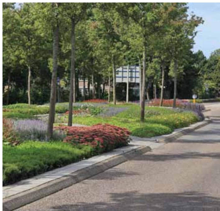
De vaste planten binnen één groeiseizoen. Een vergelijkbaar resultaat op de Hoge Rijndijk in Zoeterwoude.