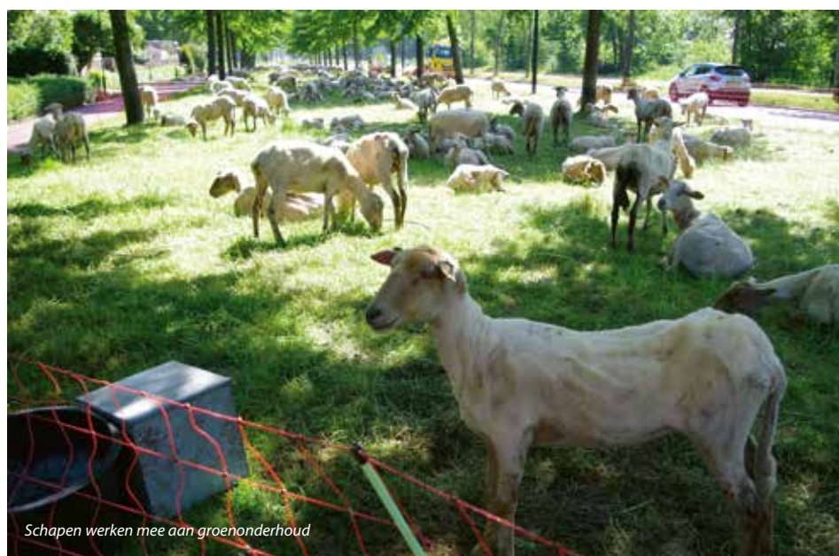
Schape werken mee aan groenonderhoud