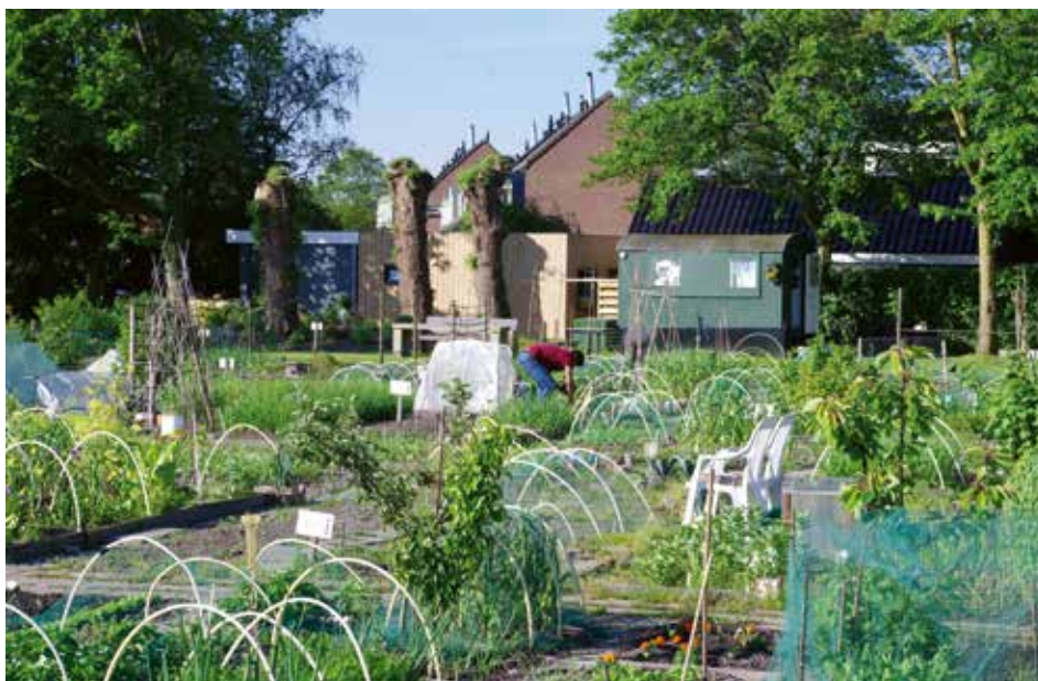
Buurttuin De Middenmoes moet ooit wijken voor nieuwbouw