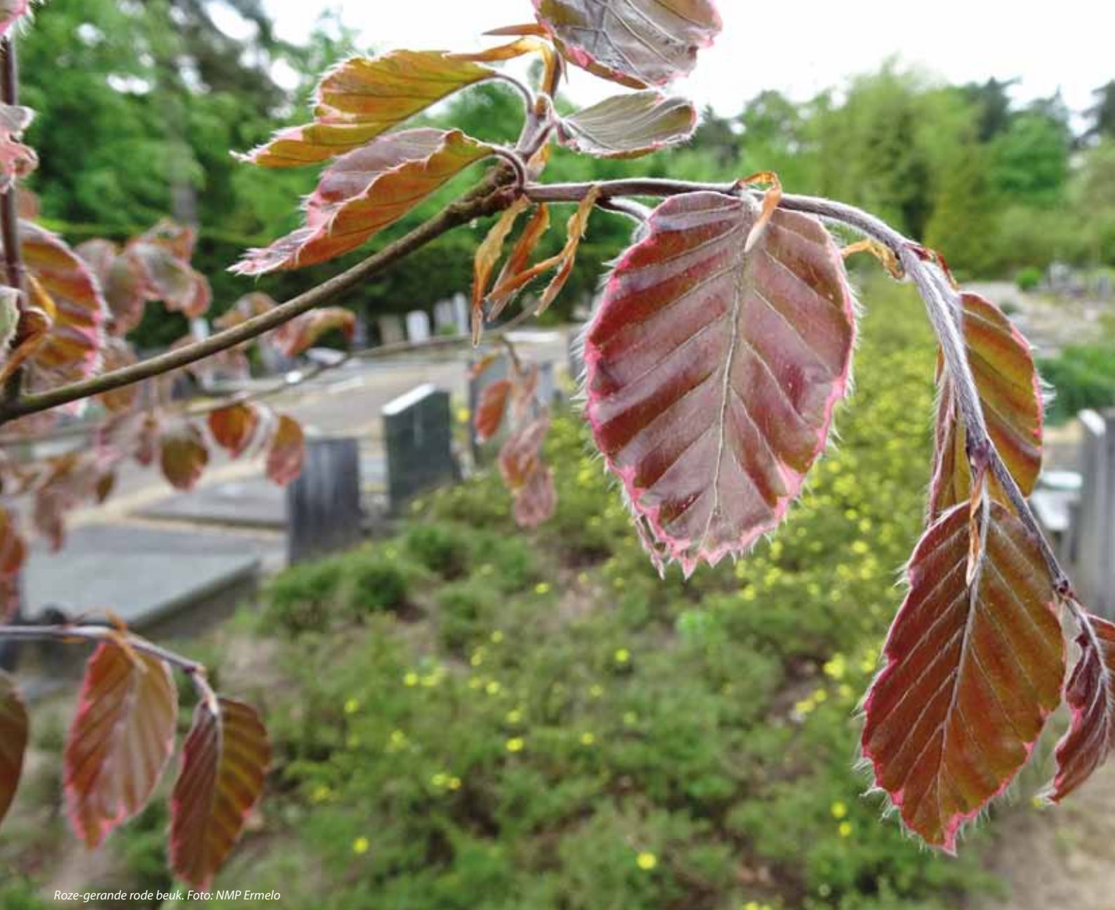
Roze-gerande rode beuk.