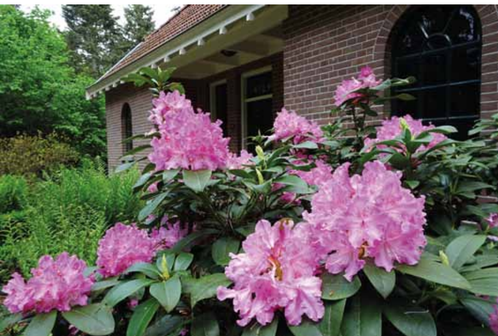
Voormalige baarhuisje.

www.stad-en-groen.nl/artikel.asp?id=41-7253