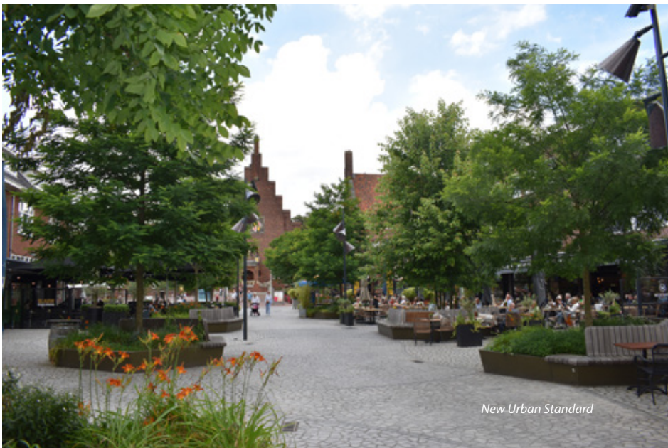
New Urban Standard

hebben verzameld. Leer meer over de boomkroonvolumes en ecosysteemdiensten die deze bomen leveren. En ontdek hoe wij boomdata vertalen naar bruikbare informatie voor boombeheerders en beleidsmakers. Mis deze kans niet om te zien hoe onze technologie het boombeheer transformeert!